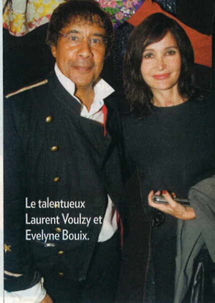
Le talentueux Laurent Voulzy et Evelyne Bouix.