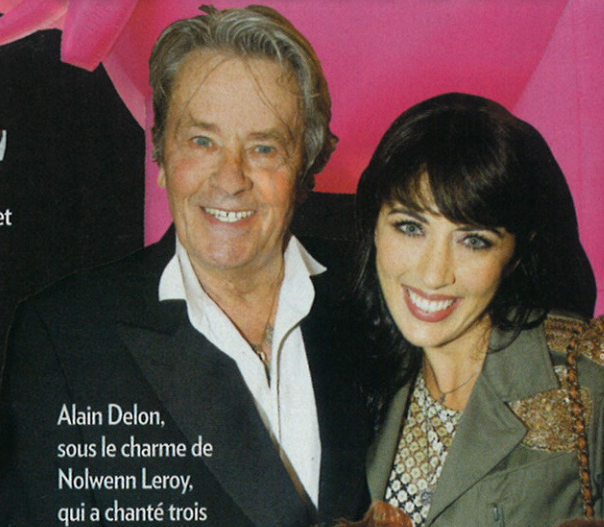
Alain Delon, sous le charme de Nolwenn Leroy, qui a chanté trois chansons avec Petula Clark.