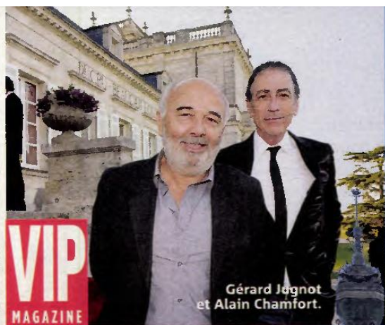
Gérard Jugnot et Alain Chamfort.