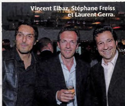
Vincent Elbaz, Stéphane Freiss et Laurent Gerra.